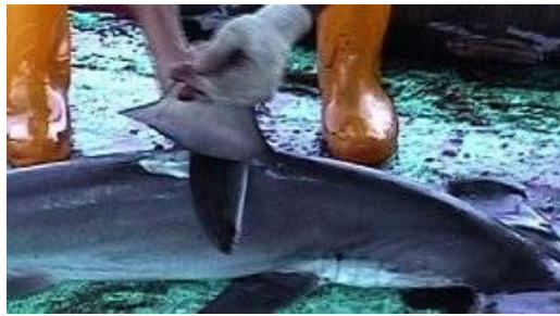
Coupe d'ailerons de requins