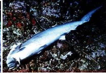
Carcasse au fond de la mer

Non seulement le finning est un acte barbare pour les Requins mais leur taux de mortalité conduit à leur extinction .